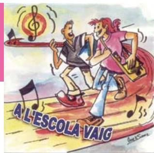
Imatge del programa contra l'absentisme escolar

La nova seu tindrà una superfície construïda de gairebé 6.000 metres quadrats, distribuïts en soterrani, planta baixa i planta primera. Disposarà d'espai per a oficines, aules de formació, tallers prelaborals, magatzems i botigues per a la comercialització dels mobles i la roba de segona mà que són la base del seu programa d'inserció en el món laboral.