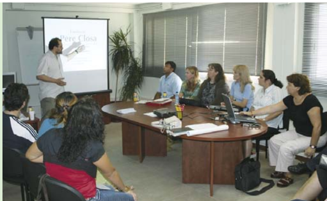
Trobada de la xarxa ROMAin, l'any 2006, a la Mina

El projecte ROMAin de la Comunitat Europea coordinat per la secretaria d'Acció Ciutadana del Departament de Governació de la Generalitat de Catalunya ha conclòs els seus dos anys de treball amb la presentació de la Guia de bones pràctiques per a la inclusió social del poble gitano a Europa. El Consorci ha participat en el projecte, juntament amb nou socis més, per aportar-hi la seva experiència en l'àmbit sociolaboral i educatiu amb la comunitat gitana.