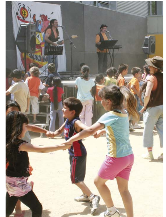
Festa de fi de curs del programa a l'Escola vaig contra l'absentisme

La fundació formació i treball té enllestit el projecte arquitectònic de la nova seu que construirà al carrer Llull del barri, en una àrea destinada a equipament comunitari, en una parcel·la cedida per l'ajuntament. Les coincidències d'objectius i sistema de treball amb el Consorci en el camp de la inserció sociolaboral a través de la formació,