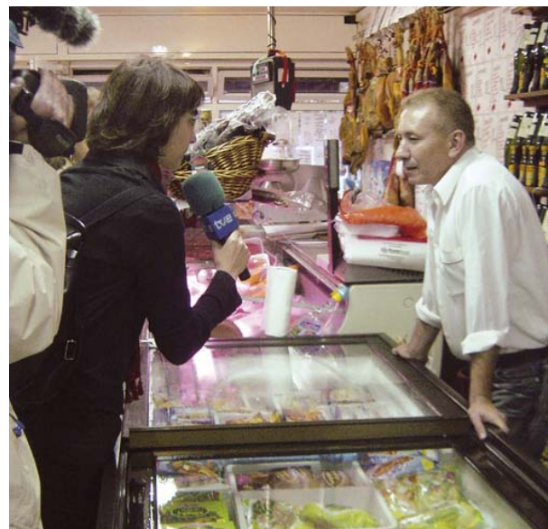
El comerç amb la campanya pel català