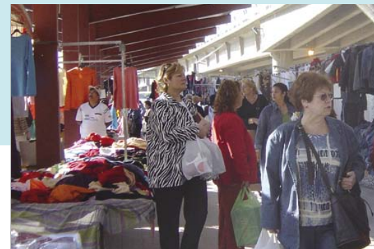
▶ Mercats ambulants

El Ministeri de Treball i Assumptes socials i la Generalitat de Catalunya, van sol·licitar finançament europeu a l'hora que impulsaven el Pla de Transformació per al decenni 2000-2010. Així, el febrer de 2001, es va acordar concedir al Consorci la gestió de l'anomenada Subvenció Global que financin, en un 45 per cent, la Comunitat Europea i el 55 per cent restant l'aporta el Departament de Treball i Indústria del govern català. L'objectiu d'integrar els col·lectius amb risc al mercat laboral per la via de la capacitat per al treball, encaixa de ple amb un dels objectius de la Unió Europea i els estats membres pels quals preveuen aquest tipus de finançament que ve del Fons Social Europeu. Han estat cinc milions d'euros invertits al llarg de sis anys, directament en la comunitat del barri, en el període 2001-2007.