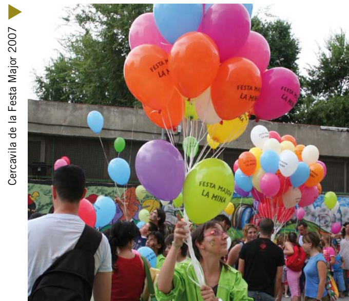
Cercavila de la Festa Major 2007

ús per part de tota la comunitat. El Consorci ha engegat programes per a la gestió dels residus i el reciclatge a través del COMA (Centre d'Orientació Medi Ambiental), l'antic PIM, que organitza xerrades informatives i compta amb un equip tècnic sobre el terreny per assessorar els veïns. Disposa, també, d'una brigada de manteniment que, a més, de funcionar com a taller prelaboral de formació, assegura la neteja i la conservació de l'entorn urbà. I, amb l'objectiu de millorar l'espai públic, s'han reparat els parcs infantils i se n'han fet de nous, s'ha organitzat un concurs d'art que ha premiat una escultura que s'ubicarà al Parc del Besòs, i s'ha llançat una campanya de sensibilització pel civisme que continuarà el 2008.