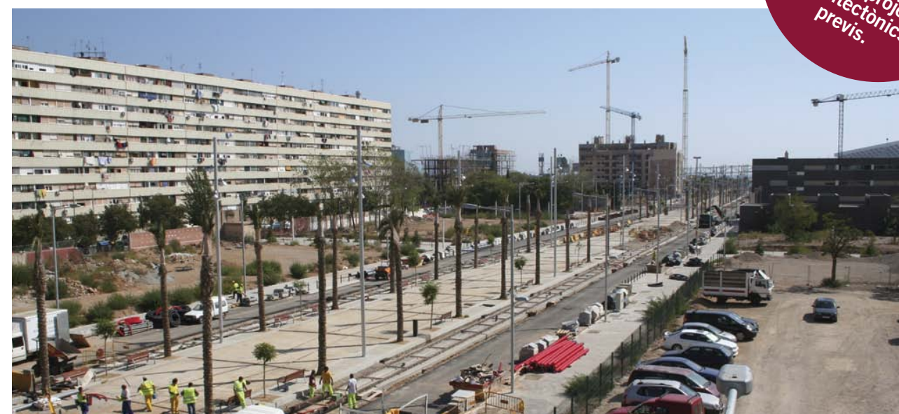
Es construiran pisos socials als dos costats de la Rambla ▲

◀ Conjunt de 3 edificis de 4 i 6 plantes Núm. d'habitatges: 66 Pisos de 4, 3 i 2 habitacions Pisos adaptats: 2 de 2 habitacions Places d'aparcament: 77 Núm. de locals: 6 Localització: c/ Llull (cantonada c/ Mart) Arquitecte: MORA-SANVICENÇ