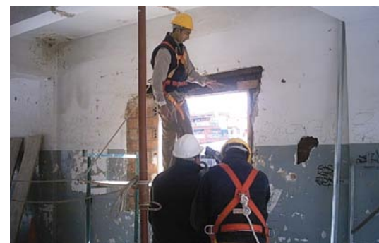
▶ Construcció (clàusules socials)