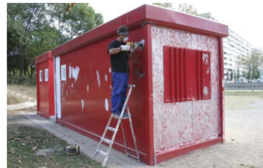
▶ Formació de joves