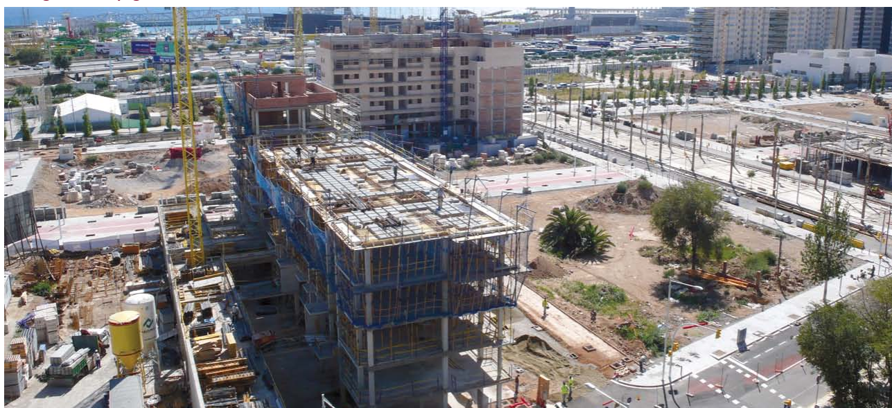
Promocions privades al costat de les parcel·les dels futurs pisos socials ▲