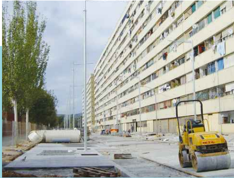
▲ Als carrers Venus-Mar i Mart (foto) les obres avancen a bon ritme.