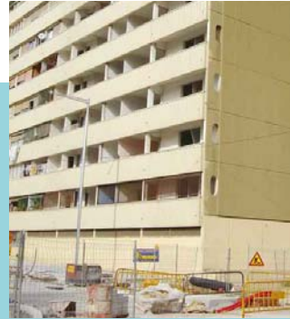
▲ Els pisos buits del carrer Mart quedaran com nous després de les obres.