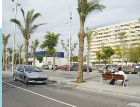
▲ Els veïns i els conductors s'han fet seva la Nova Rambla del barri.